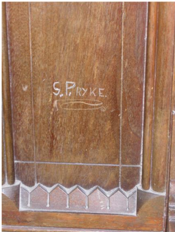
De naam van een orgelpomper in het zijpaneel gekrast.

Toen we daar rond half vier s' middags aankwamen, bleek het hele harmonium door een aantal gemeenteleden en de dominee al in hapklare brokken gedemonteerd te zijn. Het laden was dan ook een peulenschil. In een gesprek dat daarna volgde, bleek dat twee van hen ooit een officiële aanstelling als orgelpomper hadden. Hun namen waren in het zijpaneel van het harmonium gekrast.