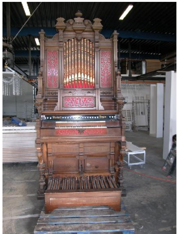
De Burdett wordt opnieuw opgebouwd.